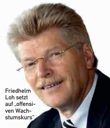
Friedhelm Loh setzt auf „offensiven Wachstumskurs“

Loh ist Inhaber und Vorstandsvorsitzender der Friedhelm Loh Stiftung. Dem ZVEI-Vorstand gehört Loh seit 2002 an, seit 2004 war er Vizepräsident und seit 2006 Präsident des rund 1600 Mitgliedsunternehmen mit mehr als 820 000 Mitarbeitern umfassenden Industrieverbands.