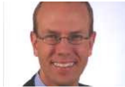
Autor Hanno Stöcker

München. Spätestens seit der EU-Osterweiterung 2004 stellt sich für viele deutsche Unternehmen der Log che die Frage, wie sie auf Mitarbeiter aus den neuen EU-Ländern zurückgreifen können. Polen etwa als h dustrialisiertes Land mit leistungsfähigen Logistikern bietet noch 15-20 Jahre einen signifikanten. Dies führt Jahren zu Betriebsverlagerungen von West nach Ost. In Deutschland selbst stellt sich eine andere Frage: größeren deutschen Unternehmen würden gerne Arbeitskräfte aus den neuen EU-Ländern einstellen. Bei Unternehmen sind es noch 44% (vgl. Abb. 1). Der Bedarf ist also da – wie aber kann er legal gedeckt wer